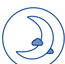
TRAVAIL DE NUIT