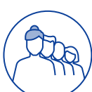
TRAVAIL EN ÉQUIPES SUCCESSIVES ALTERNANTES

L'exposition des salariés à un ou plusieurs des 6 facteurs de risque doit être déclarée si elle dépasse les seuils réglementaires.